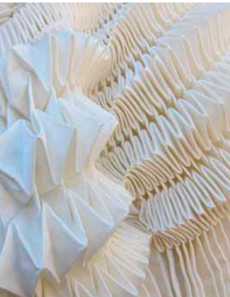
Detalj haljine desno: Tech structures